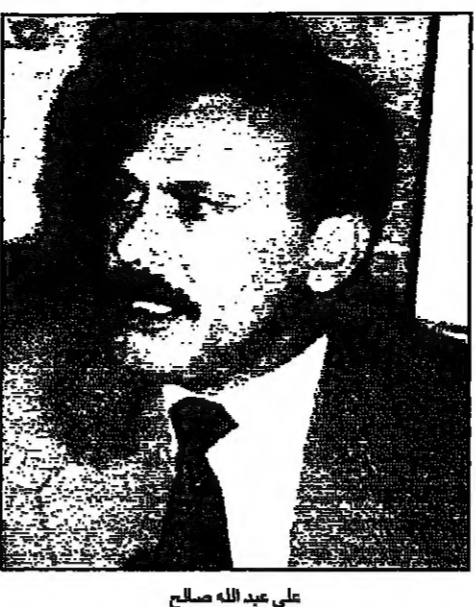
علي عبد الله صالح

الشيخ عبد الله الاحمر (يمين) ويتكلم ببقائه رغم التوجهات الصادرة اليه بتغييرهم من سبب استخدامهم وزير الداخلية والديار، ولان يخلو من اهم موقع وزاري في البنية مشيرة الى ان بعض قيادات المؤتمر تحفظ حاليا على الرئيس صالح لاستخدام وزير الداخلية من ضمنه بسبب قصوره في الحفاظ على الامن نتيجة اعتماد على قيادات امنية عميقة الخبرة بهما اعلمها لتتقي الى منطقتهم